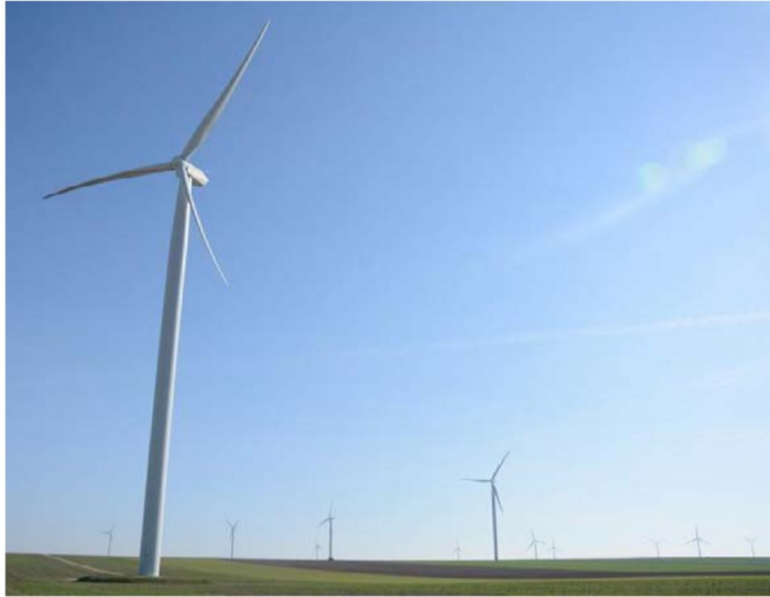
Les parcs éoliens visibles depuis le vignoble champenois sont nombreux comme ici celui près de Trécon.

« Ce projet était localisé à l'intérieur de la zone dite d'exclusion (voir ci-contre) de l'éolien autour du bien "Coteaux, Maison et Caves de Champagne", classé à l'UNESCO », explique la préfecture, chargée de suivre le développement des projets éoliens via la DREAL (Direction régionale de l'Environnement, de l'Aménagement et du Logement). Cette zone d'exclusion a été aménagée en mars 2018. En résumé, tout projet éolien à moins de dix kilomètres au